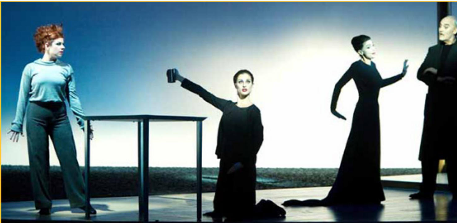
FOLKLORE EASG ANDUSIA, JIMUNO, 30 DE SEPTIEMBRE

Sábado, 20 de Marzo de 2010 09:49 - Actualizado Sábado, 01 de Mayo de 2010 19:55