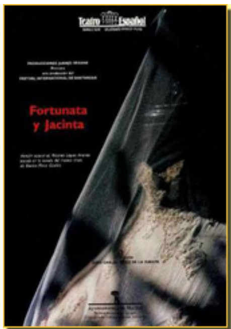
FORTUNATA Y JACINTA (TEATRO ESPAÑOL, 1994)

- Entonces ya nos plantea López Arandía dificultades de la puesta en escena de una novela que trata