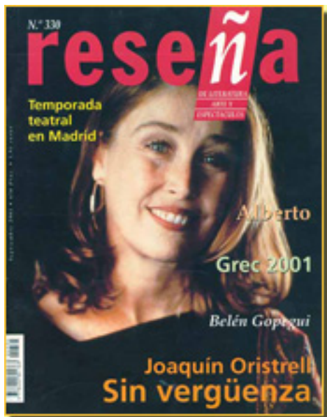
RESEÑA, 2001 NUM. 330, pp. 6

Sábado, 03 de Abril de 2010 18:49 - Actualizado Sábado, 01 de Mayo de 2010 19:32