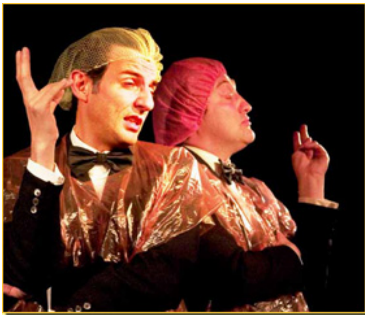
E. IANNIELLO/L. SALTARELLI