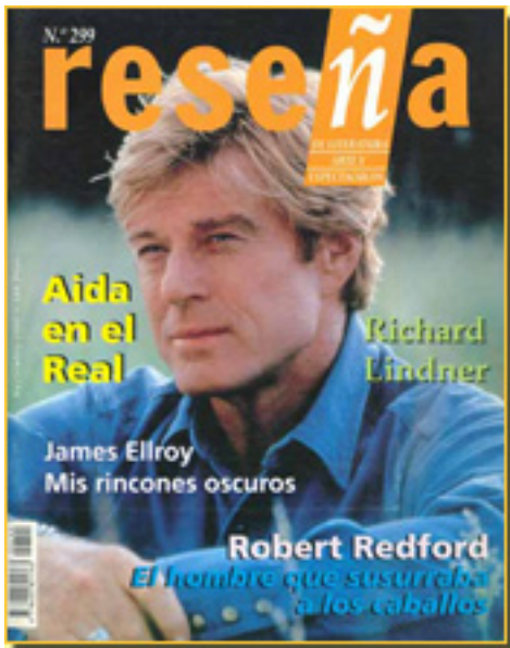
RESEÑA, 1998 NUM, 299, pp. 33

Miércoles, 10 de Febrero de 2010 09:00 - Actualizado Miércoles, 07 de Julio de 2010 06:21