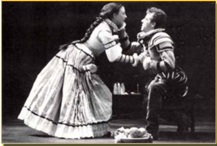
NURIA GALLARDO/CHEMA MUÑOZ

■ El affaire Bill Clinton es un juego de niños, comparado con las maléficas intenciones que guían a Sancho IV el Bravo (hijo de Alfonso el Sabio ), dominado por el “fuego en las entrepiernas”, como advierte