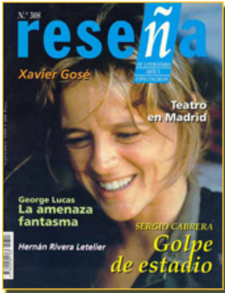
RESEÑA, 1999 NUM. 308, pp.3

Sábado, 06 de Febrero de 2010 16:18 - Actualizado Martes, 04 de Mayo de 2010 12:34